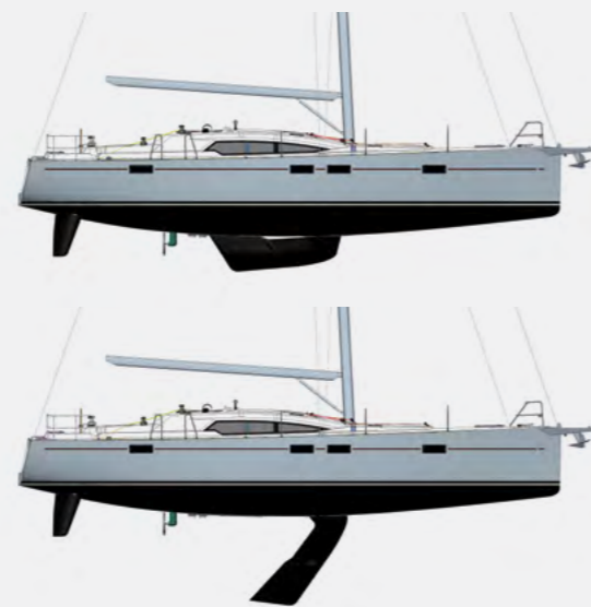
QUILLE RELEVABLE LIFTING KEEL